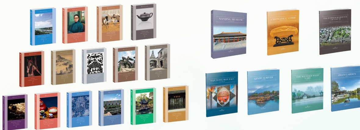
“符号江苏·口袋本”精选本英文版