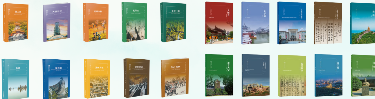
“符号江苏·口袋本”第八辑