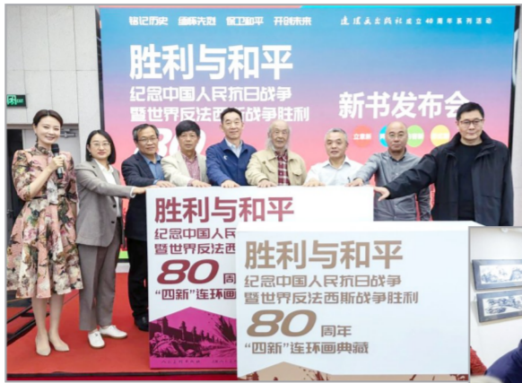
《胜利与和平——纪念中国人民抗日战争暨世界反法西斯战争胜利80周年“四新”连环画典藏》新书发布会

首届全国“美术好书”评选揭晓：权威推荐，引领阅读。 由中国图书评论学会指导、中国出版协会美术出版工作委员会主办、《中国美术》杂志承办的首期全国“美术好书”评选活动于2025年3月启动，经过严格评审，4月11日在北京揭晓最终榜单。该榜单定位“专业美术人向大众推荐的大美术好书”，评选活动旨在搭建艺术专业人士与大众之间的桥梁，为艺术爱好者选好书，让美术出版精品走进更广泛的读者群体。该榜单两个月评选一次，面向全国美术出版社为主体的所有出版社。年底将从中评选年度美术好书。本次共选出《中国书法之美——汉字美的历程》(北京工艺美术出版社)、《中外服装史》(人民美术出版社)、《艺术与文明I：西方美术史讲稿》(上海书画出版社)、《追光者：一个人和76幅肖像的时代记忆》(西苑出版社)、