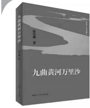
48.00元 河南人民出版社2021年4月版 《九曲黄河万里沙》张小莉著

主人公李耀辉,他既聪敏又坚韧,在商场上高歌猛进,积累了数以亿计的财富。更难能可贵的是,他还有一腔不凉的热血,多年的国外生活并未使其沉溺于灯红酒绿的繁华,反而使他生长的小乡村在记忆深处越来越清晰。他是黄河哺育之下的中原儿女美好品德的集中化身,也是将承载着改变落后家乡的重任。终于,在阔别家乡20年之后,他命运般地带着所有美好的品德回到了这片土地,投资设立专门针对农村开发的企业,和政府达成合作,以环保、发展、福利保障和现代化为核心,不仅改善了村民的生活,带动了经济的发展,还创造了大批就业岗位,吸引大批外出务工的青壮年劳动力自觉返回家乡,从根本上