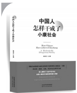
30.00元 《中国人怎样干成了小康社会》韩保江著 陕西人民出版社2021年7月版

这本书对“中国人怎样干成了小康社会”这一问题的叙述、分析、论证,做到了历史与现实照应、理论与实践结合、顶层设计与基层创造关联。 如果说总论是统起来论40年小康社会建设的历程、经验和成就,那么该书的主干部分,即分论部分,则是以“一张蓝图”绘到底,以改革激发社会活力,把发展作为第一要务、快速推进工业化、区域城乡协调发展,实施开发性扶贫,把饭碗牢牢端在自己手里,小康社会建设中的社会保障、促进人与自然和谐、把对外开放作为‘关键一招’、独特的中国精神、坚持党的集中统一领导为题,分12章论述了40年小康社会建设为什么能够取得巨大成功的多重要素,形成了“中国人怎样干成了小康社会”问题的完整论述和独特体系,既回答了我们为什么能干成小康社会,也为我们接下来“怎样干成全面现代化”提供了思考和参考。在这些论述中,作者集中描摹了中国的小康社会从“一张蓝图”构想全面建成历史进程中以改革为动力,以发展为主题、以工业化为抓手,以协调发展为战略策略,以开发性扶贫为重点举措,以聚焦“三农”问题为底线思维,以基本社会保障为制度依托,以促进人与自然和谐为鲜明特征,以对外开放为外部条件,以中国精神为动力源泉、以党的集中统一领导为根本保证的壮丽画卷,这样的分析架构既形象直观,又深刻系统,既有翔实资料,又有独到见解,为我们深刻理解全面建成小康的重大意义,满怀豪情迈向全面建成社会主义现代化强国的第二个百年目标提供了帮助、增强了信心。