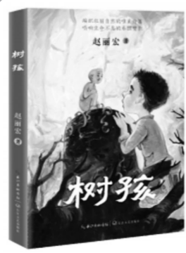
30.00元 《树孩》赵丽宏著 长江文艺出版社2021年9月版

虽然故事是虚构的,但是其间却不难发现作者真实的情感和对生活真切的观察。赵丽宏一向以诗歌和散文闻名,他的诗和散文常常包含着对大自然的深爱和对人间情感的体悟,其中大多都是写实的,写实的情感和真实的个人经历。在一次关于《树孩》的座谈中,赵丽宏提到了自己经历的真实故事——18岁时,家门口那棵像亲密朋友一样的合欢树被砍伐做成了扁担。赵丽宏说:“那种感觉就像自己的朋友被‘杀’